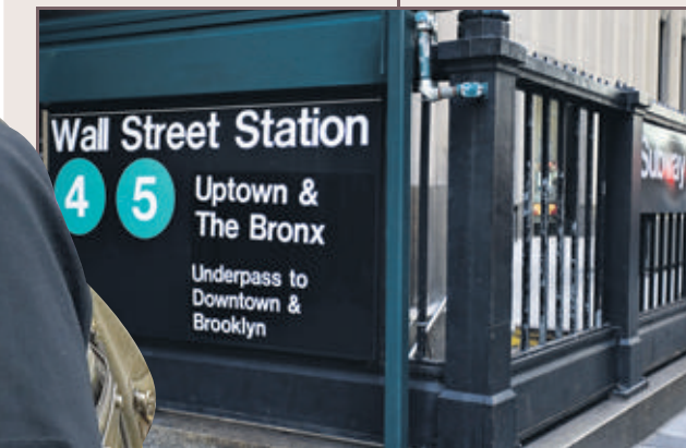
Claudia s'inspire alors de la signalétique du métro de New York. Et insère le «T» de «taxi» dans un cercle.

Voici la première version du visuel pour les taxis new-yorkais présenté par la graphiste suisse. Sobre, clair, élégant. Mais pas assez fun, pour la Ville.